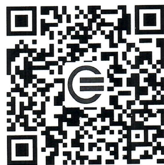
教育装备网公众号