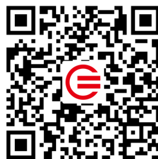
教育装备网公众号